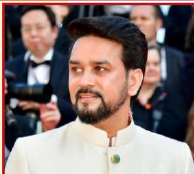
Shri. Anurag Singh Thakur Minister of Youth Affairs & Sports Govt. of India

The overall role of the Ministry of Youth and Sports is to facilitate and ensure the full development of young people's potential through the provision of strategic supportive networks and initiatives for character development, entrepreneurial activities, sports and community based civic initiatives. The Ministry formulates and implements policies on youth development as well as promotes and facilitates sports development within the framework of existing national policies and priorities.