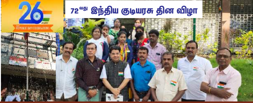
சிறப்பு விருந்தினருடன் அறக்கட்டளையின் அலுவலக ஊழியர்கள்

“வங்கம் தந்த சிங்கம்”, தேசிய தலைவர் — நேதாஜி சுபாஷ் சந்திர போஸ் —