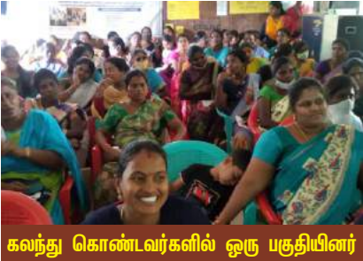
கலந்து கொண்டவர்களில் ஒரு பகுதியினர்