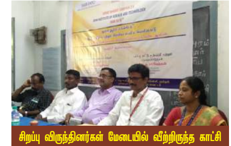
சிறப்பு விருந்தினர்கள் மேடையில் வீற்றிருந்த காட்சி