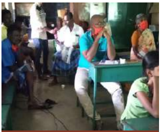
கலந்து கொண்டவர்களில் ஒரு யுத்தியினர்