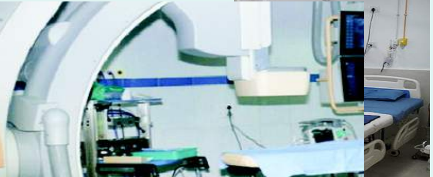
கார்டியாக் பரிசோதனைக் கூடம் தீவிர சிகிச்சைப் பிரிவு