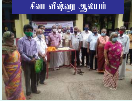
சிவா விஷ்ணு ஆலயம்