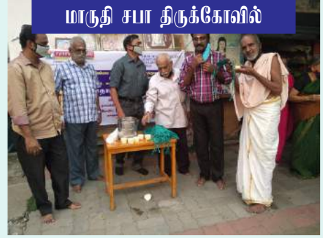
மாருதி சபா திருக்கோவில்

“கொரோனா வந்தால் நாம் பயப்படக்கூடாது. நம்மை நாமே தனிமைப்படுத்திக் கொள்ள வேண்டும்.”