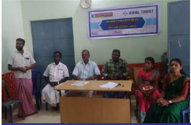
விழாவில் பங்கேற்ற சிறப்பு விருந்தினர்கள் மற்றும் இளம் பெண்கள்

“வளரிளம் பெண்களுக்கான வாழ்க்கைத்திறன் மேம்பாட்டு பயிற்சி”