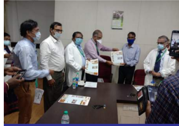
வள்ளி செய்தி மடல் வெளியீட்டு விழா